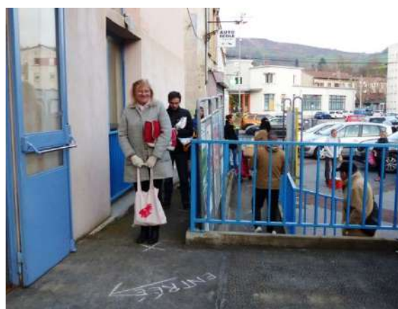
Organisation de l'AMAP du Creux, à St Chamond (42)

« Depuis la semaine dernière, nous avons mis en place une "amap'drive"» (Amapienne de Mines de Liens, Chessy, Rhône)