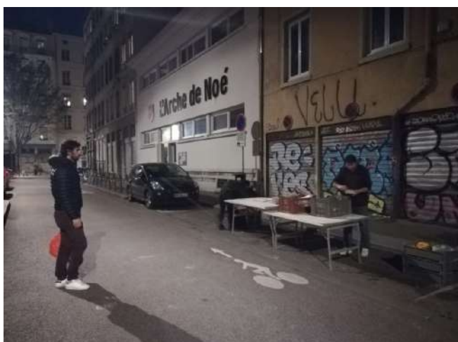
Livraison d'AMAPopote Lyonnaise devant le local habituel, à Lyon

La plupart des AMAP bénéficient de salles prêtées dans des MJC, foyers, gymnases, écoles... qui ont soudainement fermé. Des solutions dans l'urgence ont été trouvées !