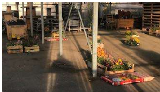
Cagettes horticoles de l'AMAP de l'Ozon, La Talaudière, Loire.