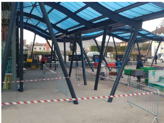
Organisation d'AMAP'Hort, à Ambérieu en Bugey (01)

« Les paysans ont préparé les commandes pour que la distribution soit rapide et sans manipulation » (Amapien des Pieds sur Terre , Lyon)